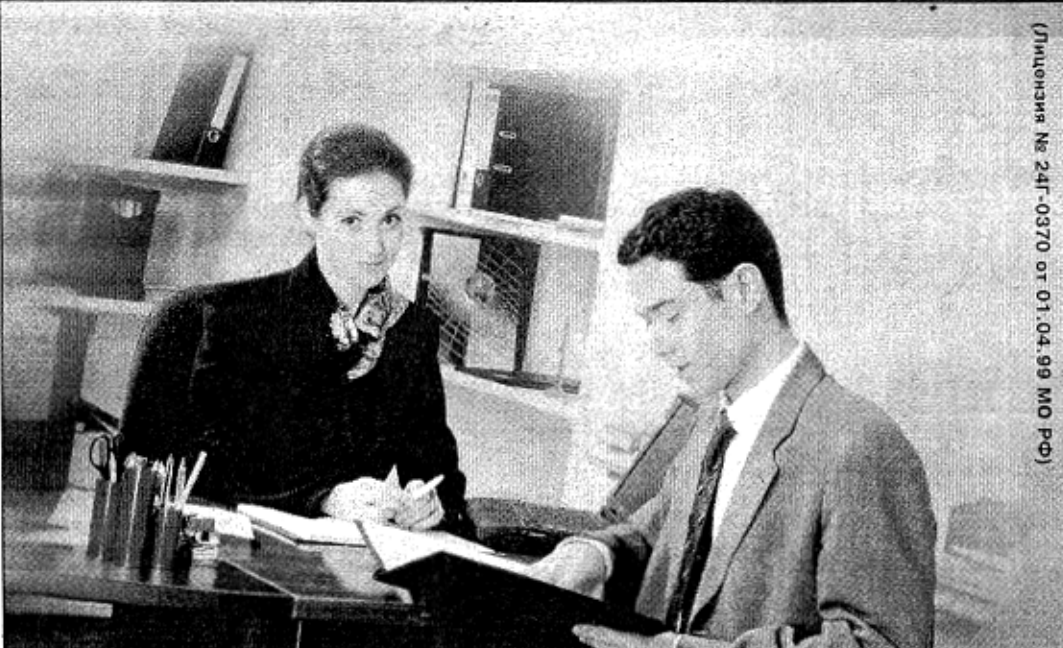
(Лицензия № 24Г-0370 от 01.04.99 МО РФ)

Чем занимается коммерсант, допустим, на производстве? Он решает проблему сбыта. Это всегда организатор внешних связей, переговоров фирмы. Вершина карьеры по этой специальности - управляющий торговым предприятием либо